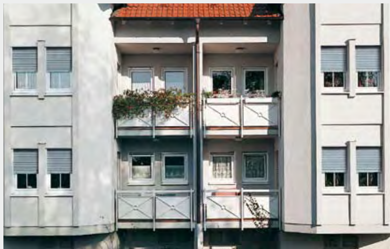
Privathaus, Abbildung Schüco